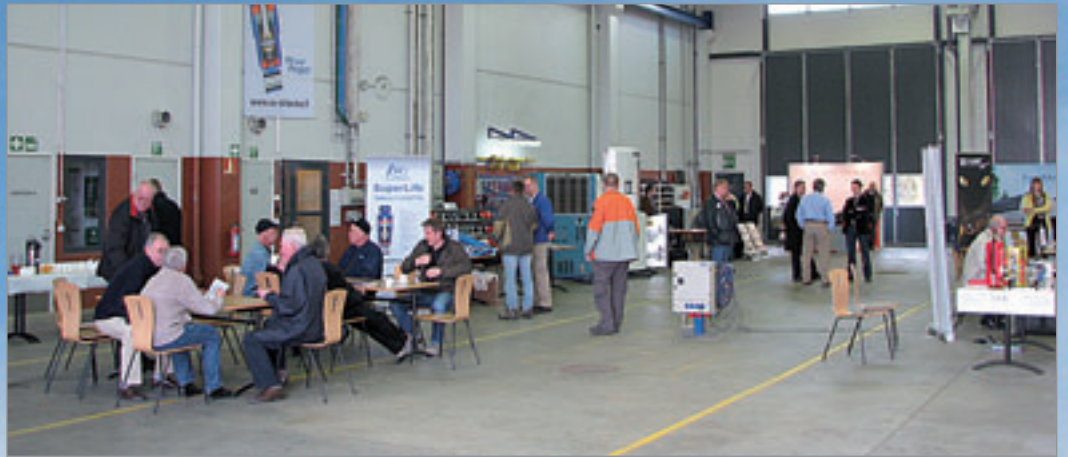
Ekerin yhteistyökumppaneita oli paikalla viitisentoista, esittelemässä omia tuotteitaan. Myös asiakkaita kävi tilaisuudessa tasaiseen tahtiin ja juttua piisasi, enimmäkseen ruotsiksi - Pohjanmaalla kun oltiin.

Grillimakkara, kahvi sekä karjalanpiirakat tekivät kauppansa, väkeä kävi kahden päivän aikana arviolta reilut 300 henkeä. Myös Ekerin yhteistyökumppaneita oli runsaasti paikalla, kuten rahoitusyhtiöiden, kylmälaite- ja akselivalmistajien sekä raskaan kaluston varaosa- ja tarvikeliikkeiden edustajia. Kuorma-autojen sammuttimetkin sai tarkastettua paikan päällä Navitek Oy:n toimesta.